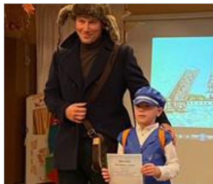
Досуг "Кто стучится в дверь ко мне"

Таким образом, работая в рамках Концепции информационно-просветительской работы по формированию культуры чтения в семьях воспитанников, можно увидеть рост интереса к художественной литературе у детей и родителей, расширение багажа литературных знаний, развитие навыков бережного, созидательного отношения к книгам, восстановление традиций семейного чтения.