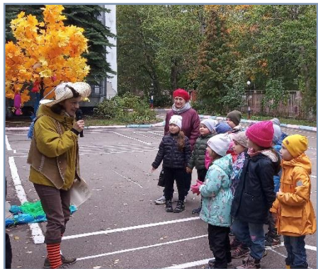
Досуг "В гости к Незнайке"

По завершению проекта проводится досуговое мероприятие в виде конкурса чтецов, утренника, театрализованной постановки, викторины, где подводятся итоги проекта, закрепляются полученные в ходе проекта знания. Родители – постоянные активные участники досугов.