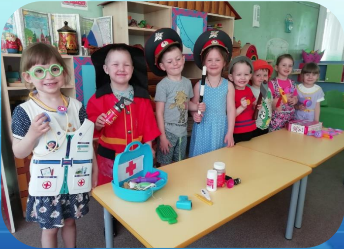
Центр сюжетно-ролевых игр

Цель: знакомство детей с различными профессиями, развитие навыков социального взаимодействия и речевой активности, воображения, творчества.