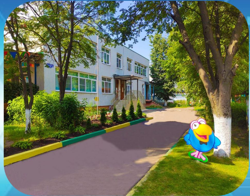
Муниципальное дошкольное образовательное учреждение детский сад №18 Орехово-Зуевского городского округа